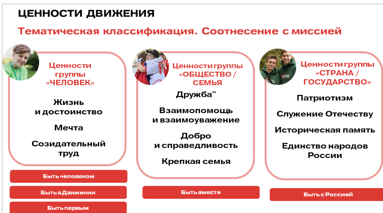
Рис. 2. Ценности Движения: тематическая классификация

Торжественное обещание, произносимое участниками, – является ключевым моментом процедуры посвящения. Очень важно, чтобы участники и присутствующие понимали значение и смыслы, заложенные в текст обещания. Текст обещания можно разобрать с участниками процедуры до ее проведения, на подготовительном этапе.